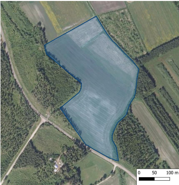
Kuva 2. Pohjoinen lisäys alkuperäiseen hankealueeseen.

Alue rajautuu Herrantiehen sekä ympäröiviin metsäalueisiin ja peltoihin. Pellolla viljeltiin kartoitusvuonna kauraa. Kuvissa 3-5 on näkyvissä hankealueen eri osia.