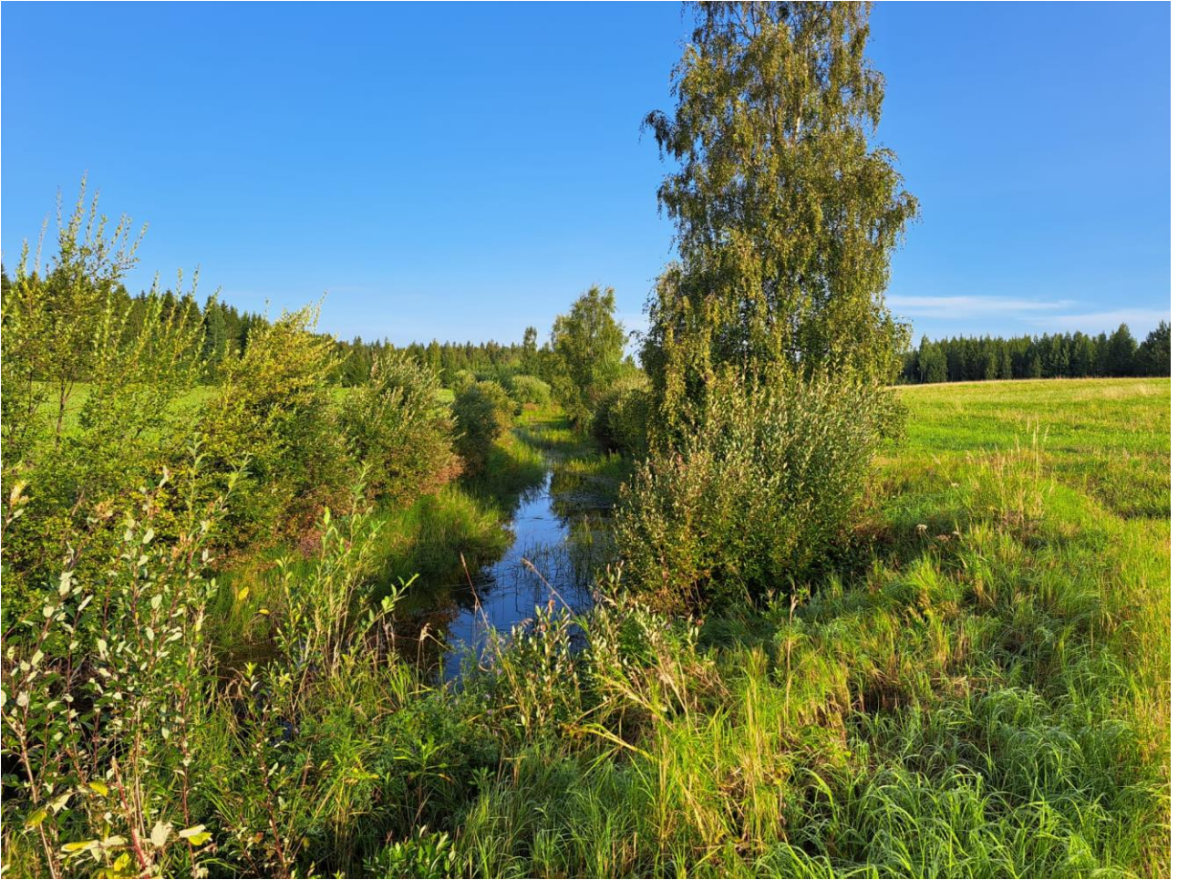
Kuva 7. Kaipaispuro eteläisellä hankealueella.