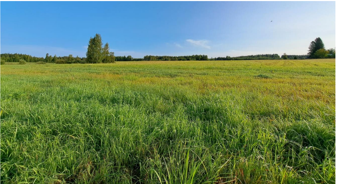
Kuva 8. Pelto oli kartoitusvuonna nurmella.