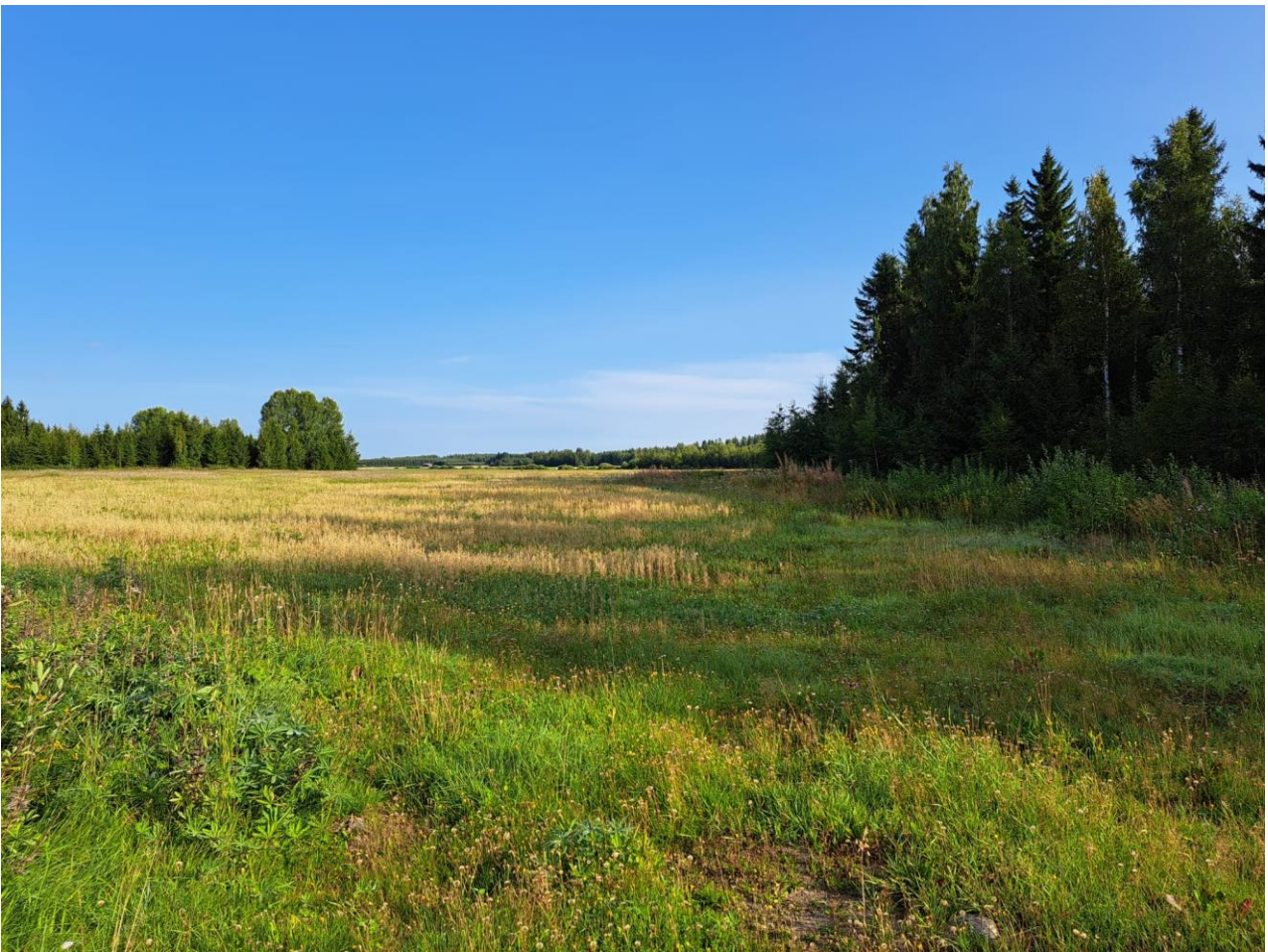
Kuva 5. Näkymä Herrantien levikkeeltä.