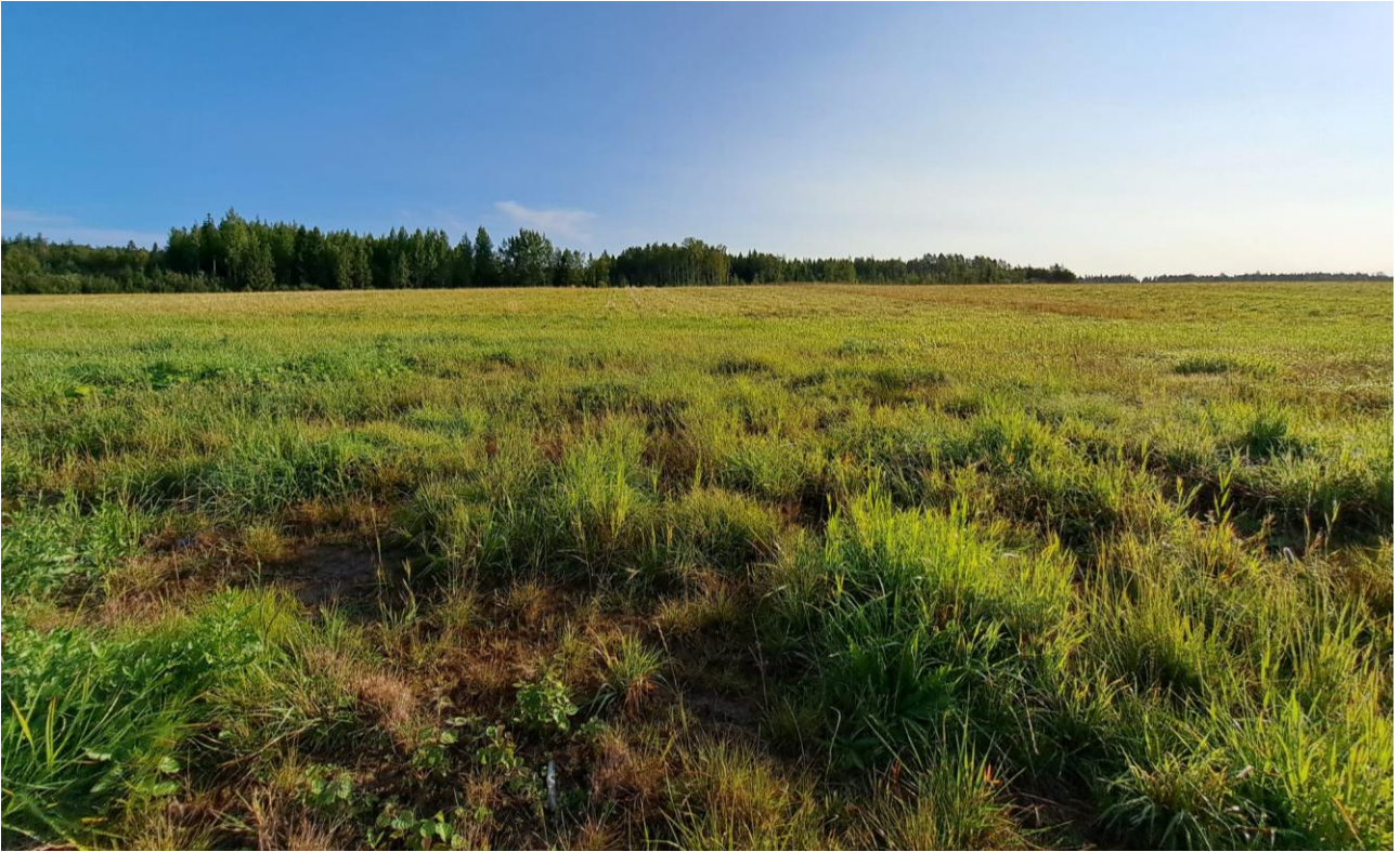
Kuva 9. Näkymä Samulintieltä hankealueen suuntaan.