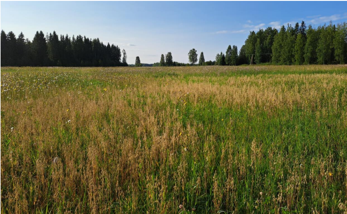
Kuva 3. Näkymä hankealueen keskeltä Herrantielle.

Alue rajautuu Herrantiehen sekä ympäröiviin metsäalueisiin ja peltoihin. Pellolla viljeltiin kartoitusvuonna kauraa. Kuvissa 3-5 on näkyvissä hankealueen eri osia.