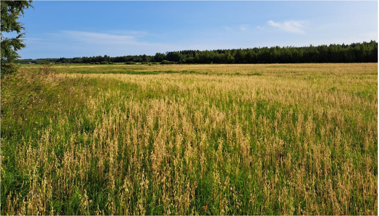
Kuva 4. Näkymä hankealueen keskivaiheilta pohjoiseen.